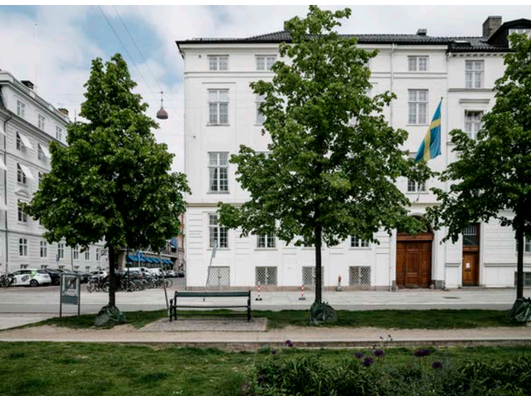
Sedan 1920-talet har Sverige huserat i hörnet Sankt Annæ Plads och Amaliegade.