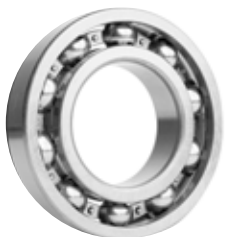
Rolamento de esferas.

Você entra na sua casa, mas está um pouco escuro, você cai em cima de um skateboard (carro de sabão na versão angolana) de seu filho. Sabe que o skateboard tem pneus e o mais importante para o skateboard andar rápido e bem é o rolamento de esferas - invenção sueca.