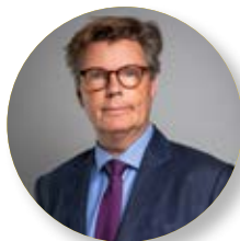
Lennart Killander Larsson Embaixador da Suécia em Angola

S uécia e Angola enfrentam um futuro brilhante que está enraizado numa longa história conjunta. O envolvimento da Suécia em Angola remonta a mais de 50 anos. As relações políticas, económicas e culturais entre governos, autoridades, empresas, instituições culturais e organizações privadas criaram vínculos únicos entre os povos que garantem maior desenvolvimento e estreitar das relações bilaterais.